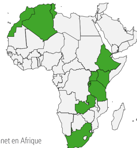
RGT Planet en Afrique