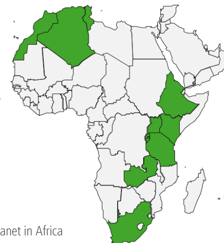
RGT Planet in Africa